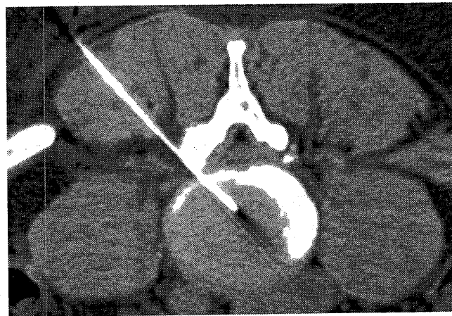
図 1: 軸索外に対する横からのアプローチによる椎間板内および神経節周辺へのオゾン-酸素混合ガスの注入

全ての患者に対して処置 6 ヶ月後に、MR を用いて追跡調査を行い、椎間板の体積減少を評価して完全な追跡とした。腰痛症神経根症状の変化に関する臨床結果は、修正 MacNab 法を用いて処置 6 ヶ月後に調査した。診察は 2 人の医師が行い、紙面でのアンケートと対面でのインタビューを行った。